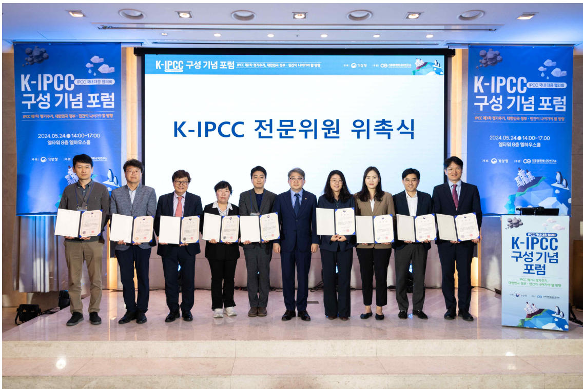
| 전문위원 위촉식 기념 사진 |