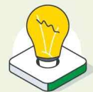
AI 리스크 최소화