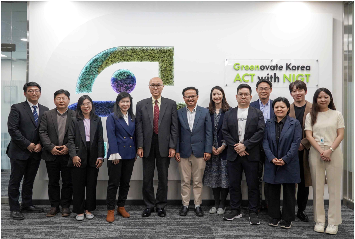
[관계자 단체 사진]